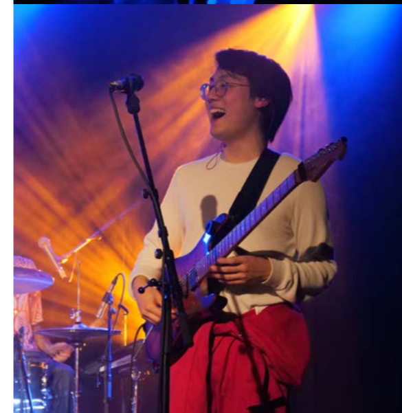
< Panache! lors de la finale du tremplin Pulsations en novembre 2021